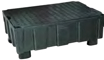
Art. nr. REC-1021 (CEM8424FPE)