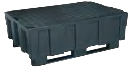
Art. nr. REC-1022 (CEM8424SPE)