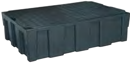
Art. nr. REC-1020 (CEM8424PE)