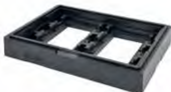
Art. nr. PLB-9040 (PLB-904)