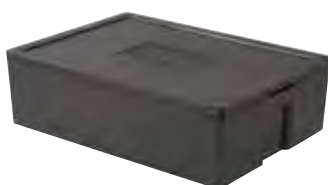
Art. nr. PLB-4012 (PLB-067)