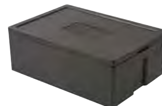
Art. nr. PLB-4016 (PLB-068)