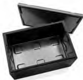
Art. nr. PLB-4000 (PLB-072)