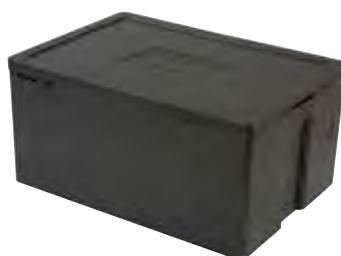
Art. nr. PLB-4027 (PLB-070)