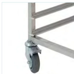
verzinkte wielvorken (niet voor diepvries)