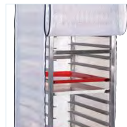
beschermhoes in optie (HIN-6400)