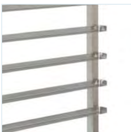
hoge opstand achteraan