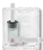
Afvoer rechts (horizontaal)