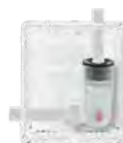
Afvoer links (horizontaal)