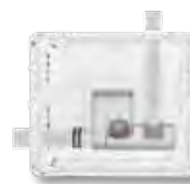
Afvoer links (horizontaal)