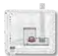
Afvoer links (verticaal)