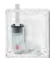
Afvoer rechts (verticaal)