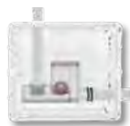
Afvoer rechts (horizontaal)