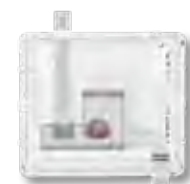
Afvoer rechts (verticaal)