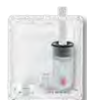
Afvoer links (verticaal)