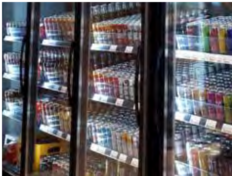
FRP - KOELEN