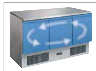
Ventilator zorgt voor gelijkmatige luchtcirculatie