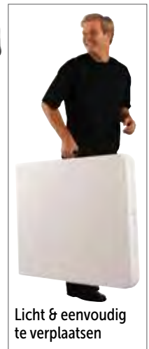
Licht & eenvoudig te verplaatsen