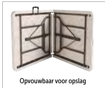
Opvouwbaar voor opslag