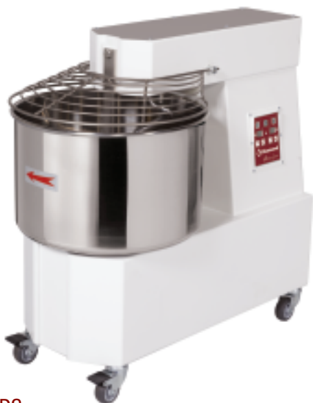
42 L 2 SPEEDS AUTOMATIC CONTROL