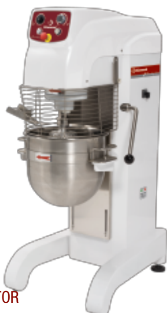
40 L SPEED VARIATOR TIMER