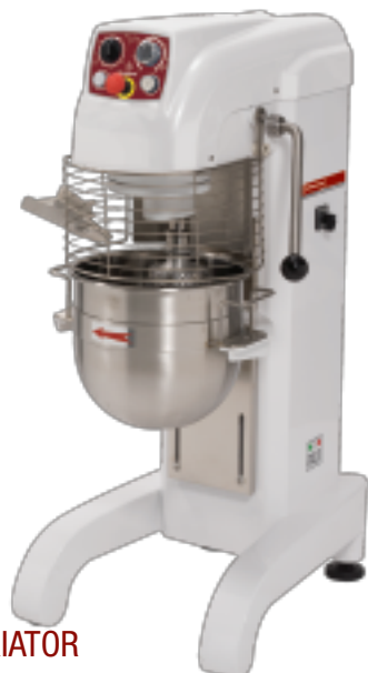
20 L SPEED VARIATOR TIMER