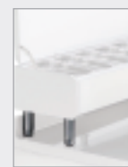
For Gastro Line Plus1/3 h155/195 mm