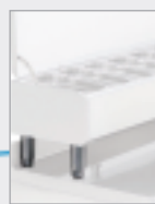
For Gastro Line Plus 1/4 h155/195 mm