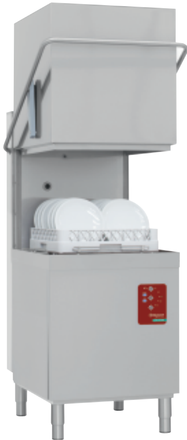
500x500 MM FULL HYGIENE BREAK TANK ANTI-POLLUTION DEVICE