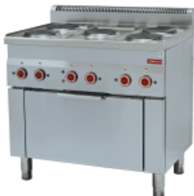
CONVECTION OVEN GN 1/1