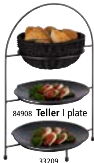
84908 Teller | plate