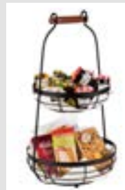
Präsentationsmöglichkeiten presentation examples